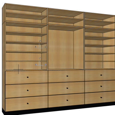
vizualizace skříňové sestavy